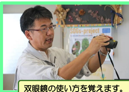
双眼鏡の使い方を覚えます。(目幅の調整・視度の調整等)