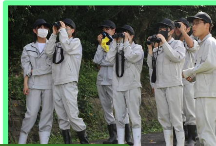
実際にフィールド(学校水田周囲、小畑川堤防)に出て、野鳥を探しました