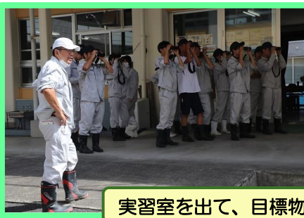
実習室を出て、目標物を見つける練習をします