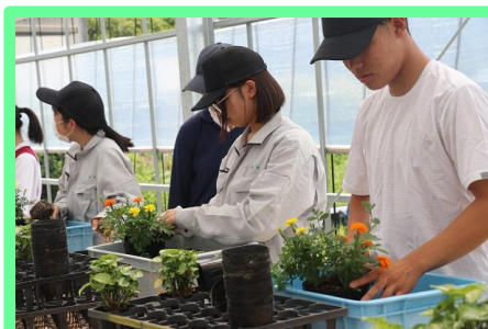
配置が決まれば、隙間に培養土を詰め、ウォータースペースを確保し、オルトランやIB化成を置いて完成です