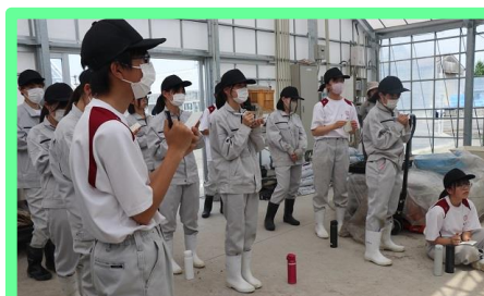
実習内容をメモします