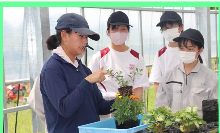
花の向きや色のバランス、苗の配置を考え5号鉢に仮置きします