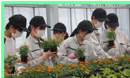
自分が育てた苗から材料を選びます。