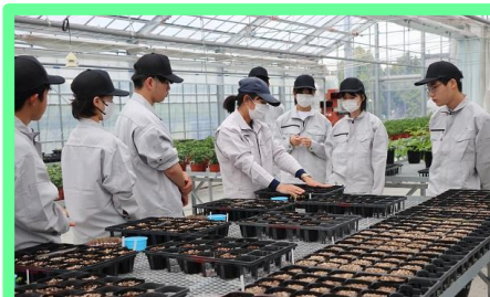
植え付け方法を学びます