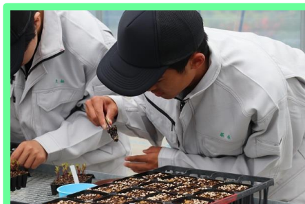
プラグトレイのマリーゴールド苗をピンセットでそっと摘み、浅植えにならないようにポットに植え付けます