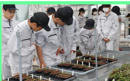
発芽したマリーゴールドを確認します