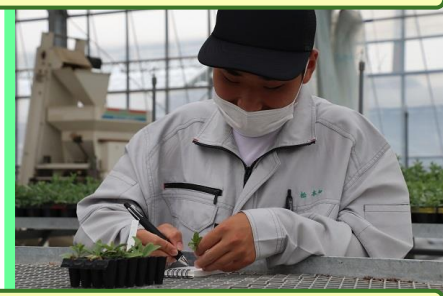
前回挿し木したアメリカンブルーの発根状況を観察しスケッチします