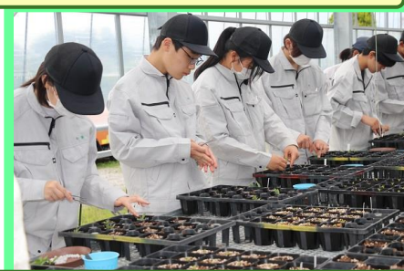
マリーゴールド同様に、アメリカンブルーの苗をポットに植え付け、IB化成を施肥しオルトランを散布します