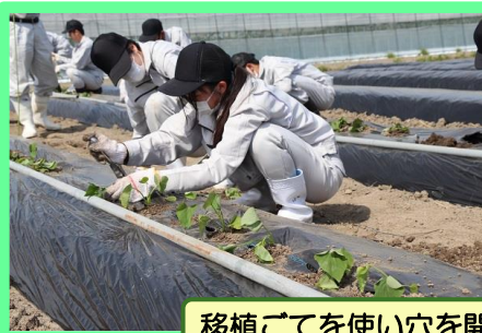
移植ごてを使い穴を開け、水平植えて定植する