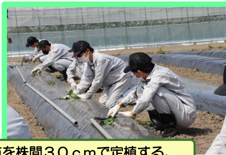
栽培品種は「紅はるか」と「紅あずま」の2種類で、1人10本の苗を株間30cmで定植する。