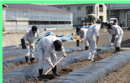
平ぐわを使い、畝間を平らにします