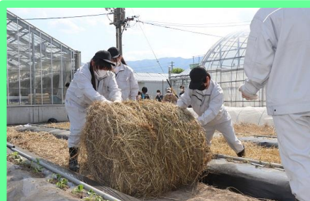
畝間の雑草抑えとして、ロールの牧草をほぐして敷き詰めます