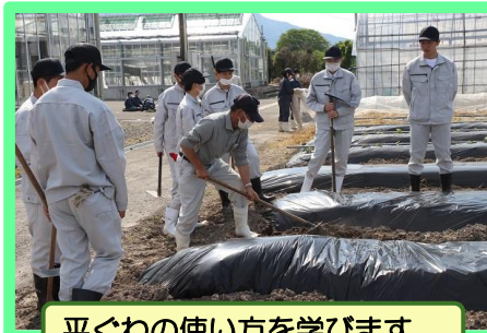
平ぐわの使い方を学びます