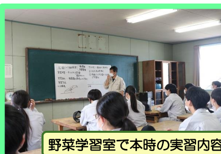
野菜学習室で本時の実習内容の説明を聞き、メモを取ります