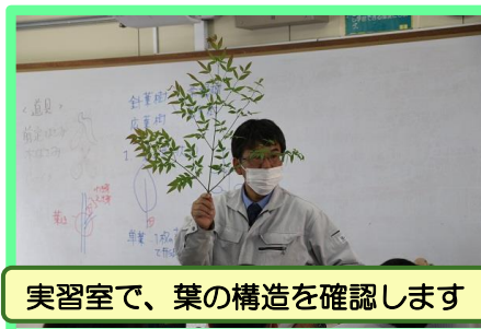
実習室で、葉の構造を確認します