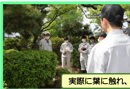
実際に葉に触れ、感触を確かめます