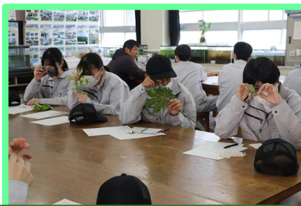
樹木園の葉を採取し、ルーペで観察した後、ノートにスケッチします