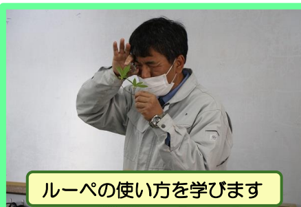
ルーペの使い方を学びます