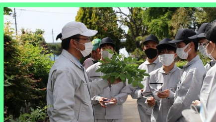
見本園に移動し、植えられている樹木の葉の特徴などを観察します