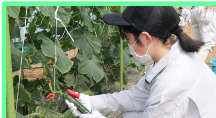
収穫基準となる塩ビパイプの太さより大きいキュウリを探し、親指につけたキュウリカッターで収穫します