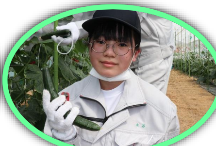
キュウリを選び、切り取るまでは真剣な表情でしたが、無事に収穫できると思わず笑顔がこぼれます