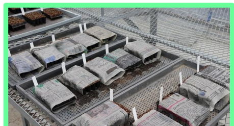
乾燥を防ぐため、湿らせた新聞紙を巻きます