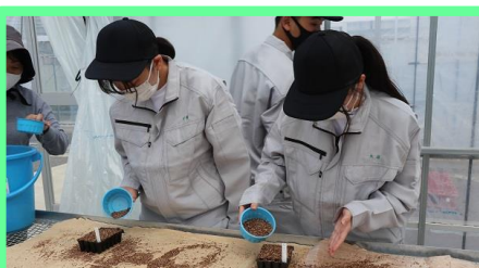
播種が終わったセルトレイに覆土します