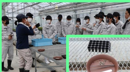
播種の方法（土の充填、植穴の空け方、種の播き方、覆土の仕方等）についてしっかりとメモを取ります