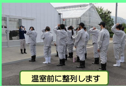
温室前に整列します

4月21日（金）5、6限 総合実習（第2回0-テ-ソ） 草花分野では、7組前半（No. 1～No.15）の生徒が学びました。5限めはマリーゴールドの播種を行い、6限めは草花部門の各施設の概要やその施設での栽培作目の説明を聞き、しっかりとメモに書き留めていました。