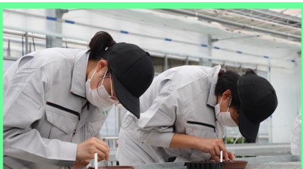
ピンセットを使い1粒ずつ丁寧に播種します