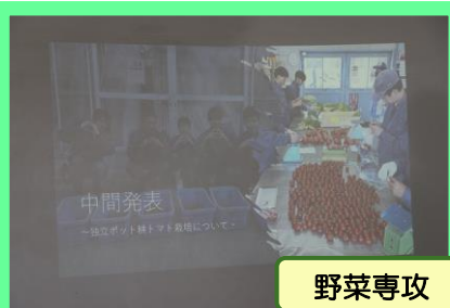
野菜専攻 トマト班6名 「独立ポット耕トマト栽培について」