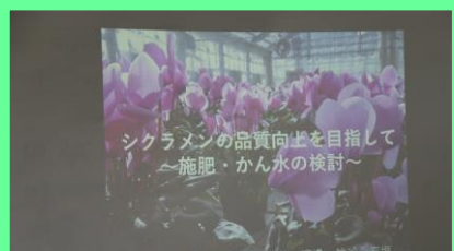
草花専攻 シクラメン班5名 「シクラメンの品質向上を目指して ~施肥・かん水の検討~」