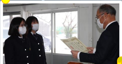
西村様代読による表彰状授与