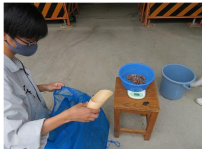
前回捕獲したザリガニを 自然乾燥させておきました