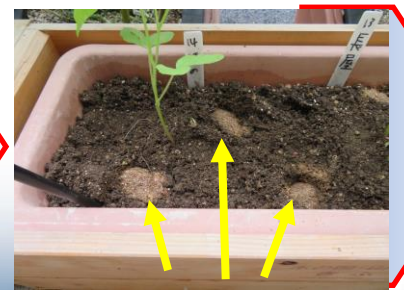
対象区ザリガニ粉末10g×6箇所を追加