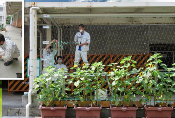
アサガオの手前ではヒマワリも元気に咲いています