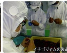
イチゴジャムの製造