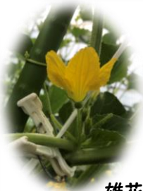
雄花です! 花弁を取り除き受粉しやすくします