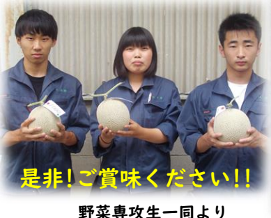
是非!ご賞味ください!! 野菜専攻生一同より