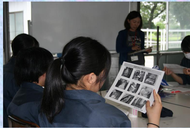
中央家畜保健衛生所の職員から「口蹄疫」の現状について講義していただきました