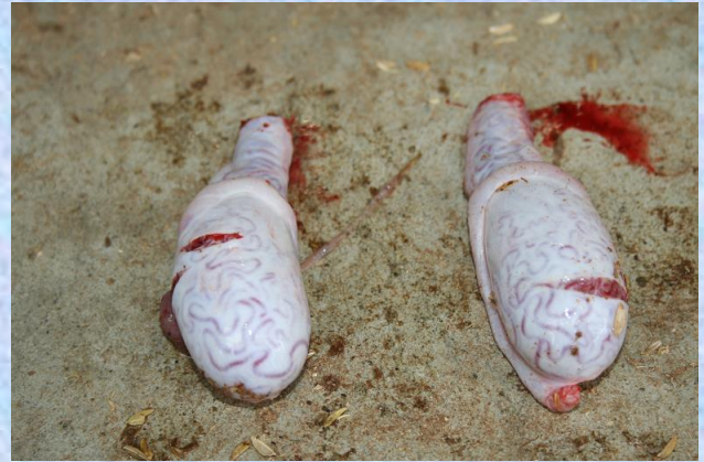
子牛に過剰な苦痛を与えないよう手早い施術で精巣を摘出されました