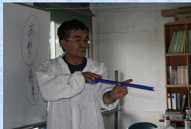
牛の性周期と膈内に挿入するシダーという器具を用いた繁殖治療法について講義していただきました