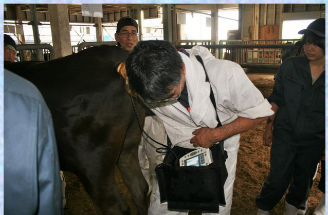
超音波画像診断装置を使い、なぎさ号の子宮内を診断しました