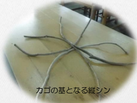
カゴの基となる縦シン