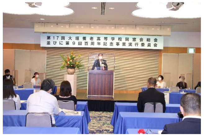
総会・百周年記念実行委員会