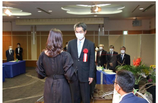
同窓会・学校功労者賞授与