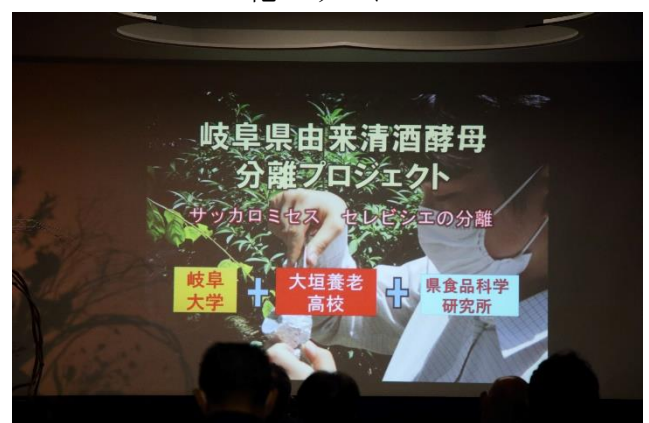
清酒プロジェクト発表