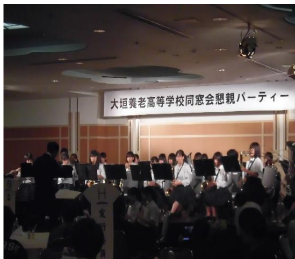
吹奏楽部による演奏