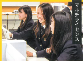
マルチライセンス