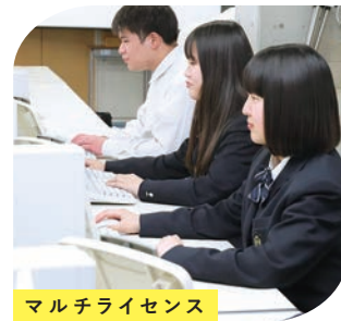
マルチライセンス