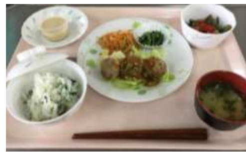
昨年のメニュー（一例）