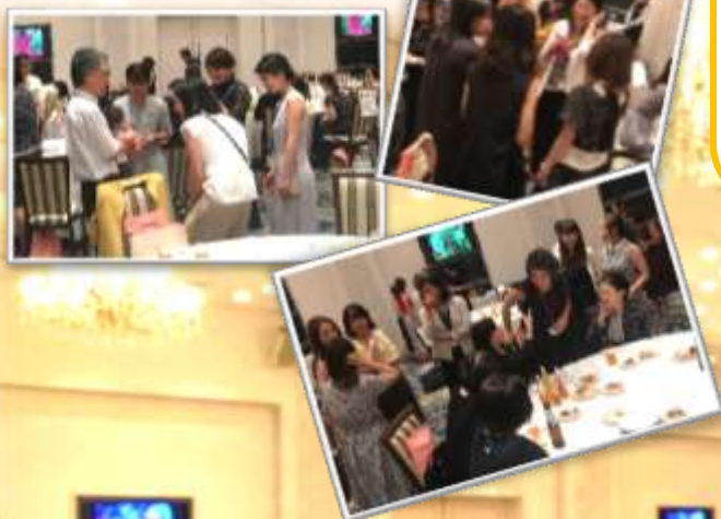
<恩師を囲んで懇親会>

はじめに同窓会総会を行いました。今年度の役員・幹事を中心に議事を進行し、事業案・予算案等が承認されました。