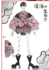
作品名「深海の生命力」