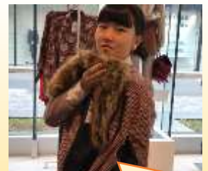
トレンド商品チェック！