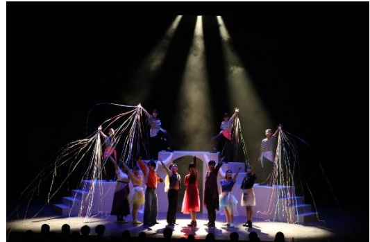
2025年夏『The show must go on』より