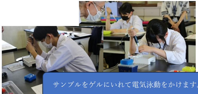
サンプルをゲルにいれて電気泳動をかけます。