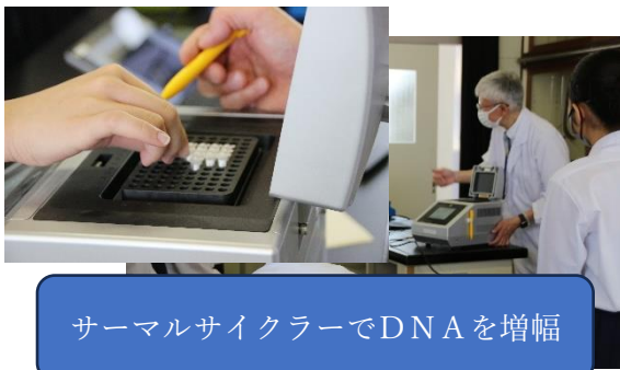
サーマルサイクラーでDNAを増幅