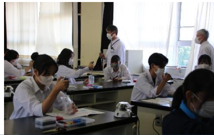
マクロピペッターの使い方を練習