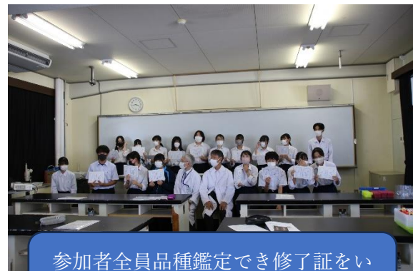
参加者全員品種鑑定でき修了証をいただきました。