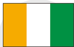
コートジボワール