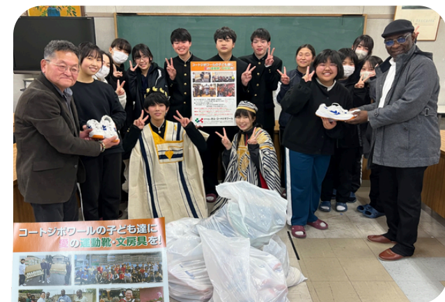
コートジボワールの子ども達に の運動靴・文房具を