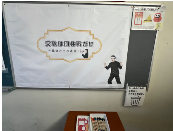
○【新規】北舎2階 「東側」 & 「西側」の [掲示板]

●3年生の皆さんには受験に向かう「仲間」を、1・2年生の皆さんには受験に向かう「先輩」を、教職員の皆様には受験に向かう「教え子」を、みんなで受験の『後押し』をしよう。