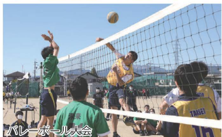
バレーボール大会