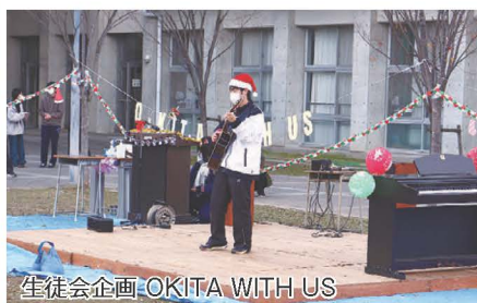
生徒会企画 OKITA WITH US