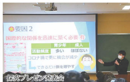
探究プレゼン発表会