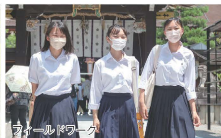
フィールドワーク