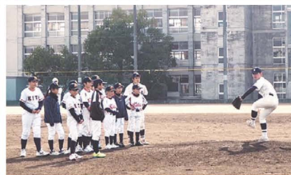
大垣北 Jr. ベースボールラボ ピッチング実演