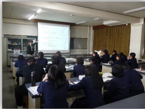
田口先生による講義