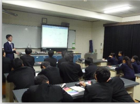
河西先生による講義