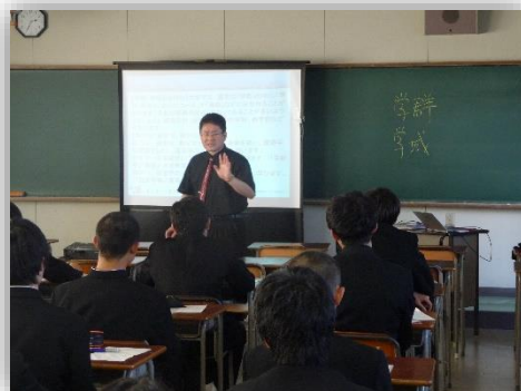
船橋先生による講義