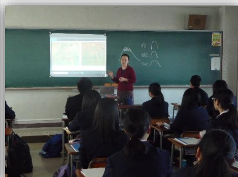
西田先生による講義