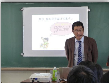
守屋先生による講義