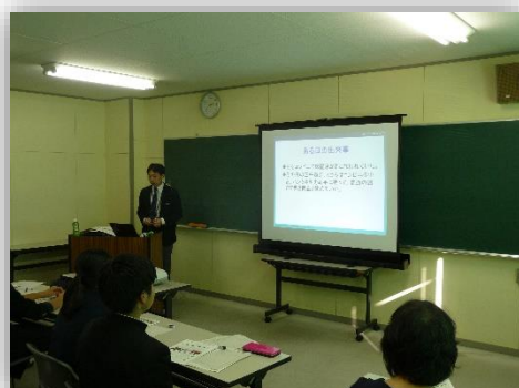
鳴川先生による講義