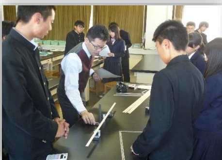
高田先生による講義