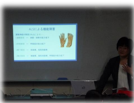
古川先生による講義