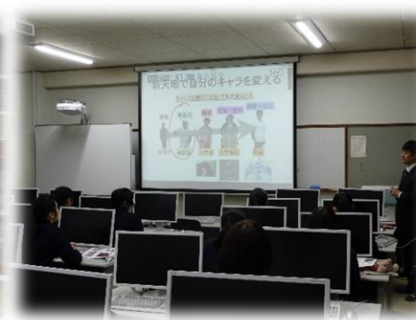
奈良先生による講義