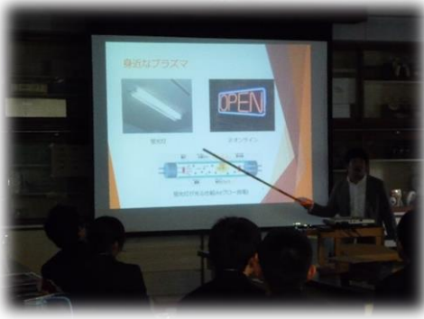
西田先生による講義