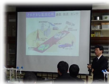
菊間先生による講義