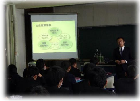
杉山先生による講義