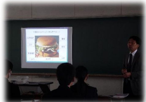
鳴川先生による講義