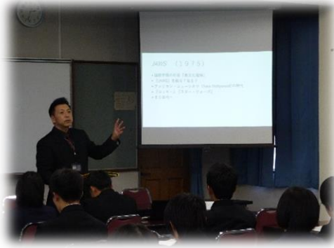
小原先生による講義