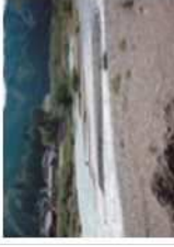
美濃市・板取川 いわたがわ