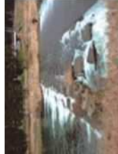
床止：高山市・荒城川 あらかがわ