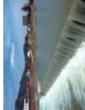
橋：岐阜市、関市・武徳川 千疋橋 取水堰：飛騨市 宮川 大久古堰 とくがわ ちんぢばし せとぎわ たいくこせき