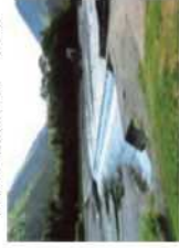
堰堤：揖斐川町・稲川 がらがわ