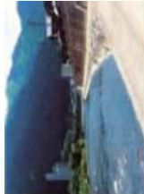
下呂市・飛騨川 ひたがわ

上流にダムのある川では、放流による増水に注意してね。事前に放流情報を確認し、川岸で遊んでいるときは常に放流予告のサインに耳を傾けよう。また、急に増水するところではぜひすぐに子どもだけで遊ばないで！