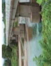
橋：岐阜市、関市・武徳川 千疋橋 取水堰：飛騨市 宮川 大久古堰 とくがわ ちんぢばし せとぎわ たいくこせき