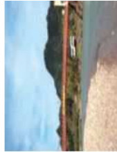
橋：美濃市・長良川 美濃橋 みのがわ