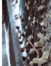
水制：下呂市・小坂川 おさかがわ

川ぞを守るために、川ぞいにコンクリートブロックが並べられているところがあるよ。すきまにはさまれたり、強い流れに引き込まれたりすることがあるのでぜひ遠くに近づかないで！