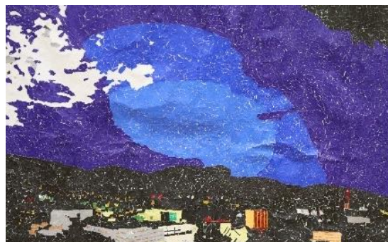
文化祭のクラス発表作品 (巨大ちぎり絵)