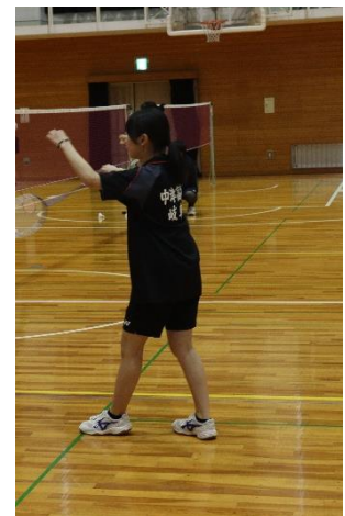
定通総合体育大会

昨年までの先輩たちの頑張る姿を見てきたので、それに続けるように努力しました。自主トレも始めて、少しずつ上達するのがわかってきて楽しかったです。他校の生徒と戦う事で、新しい発見や自分の実力を知る機会になり、緊張はしましたがとても良い経験になりました。