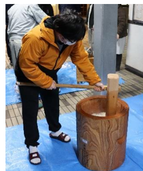
餅つき大会 ~同窓会の先輩方と一緒に~