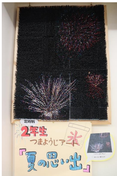
文化祭のクラス発表作品