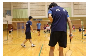
定通総合体育大会

今年度は、県大会で優勝して東海・全国大会に出場することができました。毎日の努力が結果として現れたことがうれしかったですが、「良い経験ができた」「頑張り続けて良かった」と心から言えたことが何よりもうれしかったです。まず皆さんは、気軽に部活に遊びに来てください。