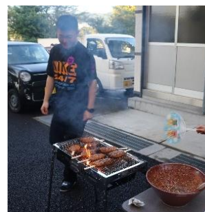
生徒会行事 (令和6年度)