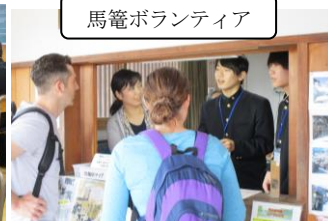
馬籠ボランティア