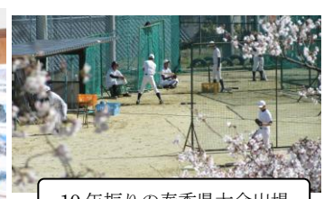
10年振りの春季県大会出場