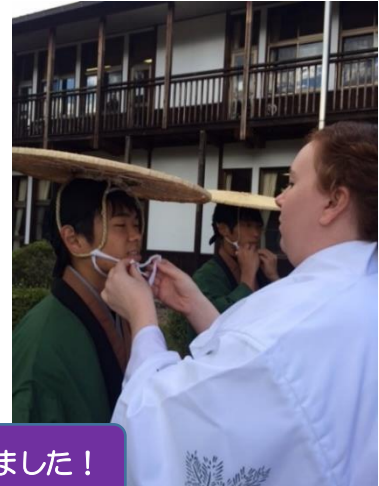
女子は巫女、侍女、男子は侍、奴になりきりました！