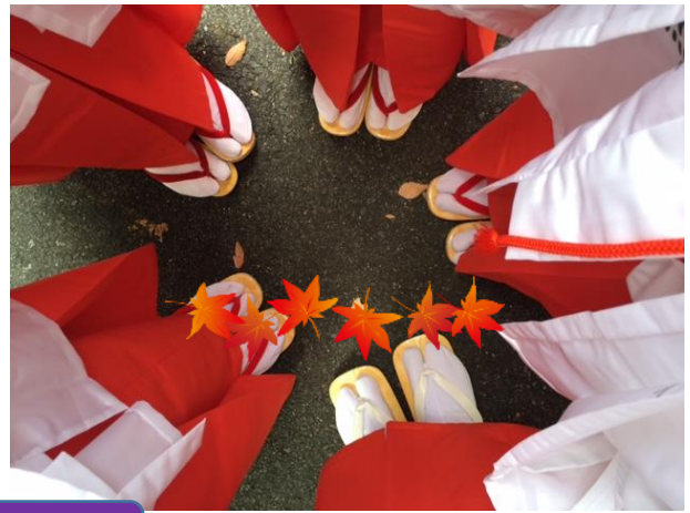
全員集合写真です！