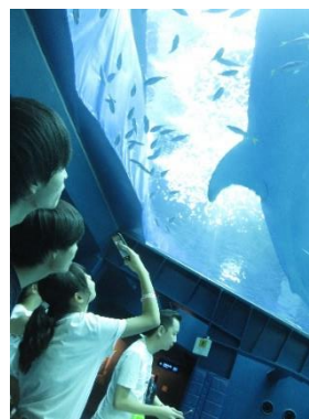
美ら海水族館にて、空気中で魚の気持ちを体験する。