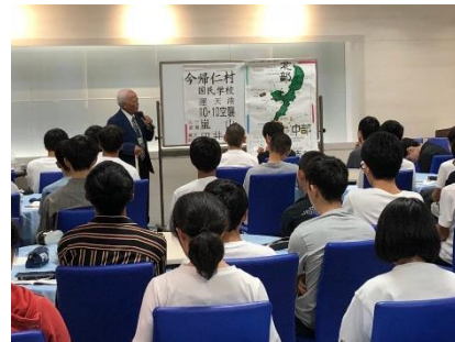
戦争体験者による平和講演会