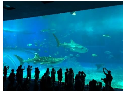
美ら海水族館にて、とことん自然を味わう。海の中に生命の原点を知る