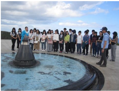
平和祈念公園にて、永遠の平和を祈る