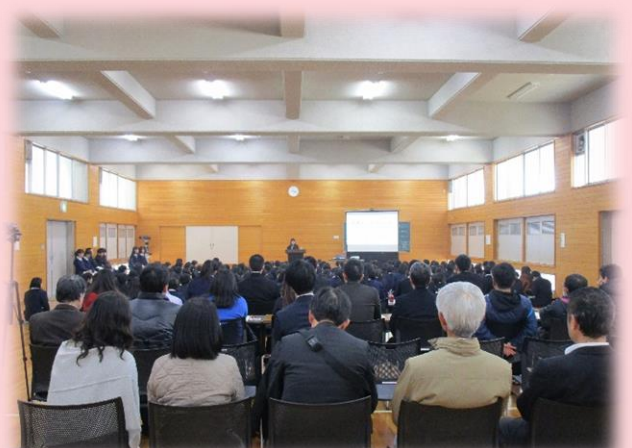
学校評議員の方々や他県の高等学校の先生方