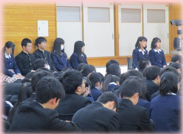
司会者（生徒会長・副会長）と発表者

●私は今回の弁論大会で去年より進化したなと感じました。去年は自分の興味のあることについて書いたけど、今年は将来の夢に関することについて書きました。弁論を書くにあたって将来のことについて詳しく自分の分かっていないところを掘って謎を解明し、自分の将来への気持ちを改めて再確認することができました。また、去年よりも自分も周りのみんなも話し方や構成など、さらにパワーアップしていたのでよかったです。去年も今年も弁論大会を通してたくさんのことを学べたし、成長させる機会になって本当によかったです。