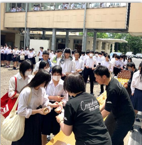
購買「フジクック」ワッフル&サンドイッチ