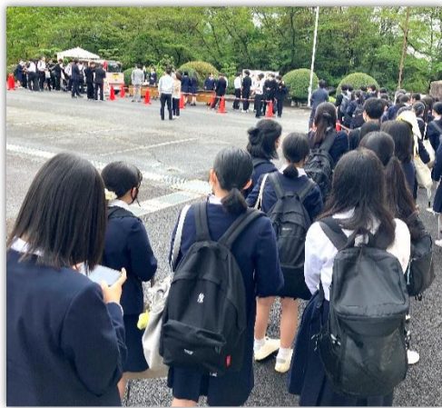
キッチンカー「虎太カフェ」