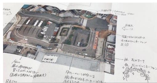
意見を書込んだ中津川駅周辺の地図