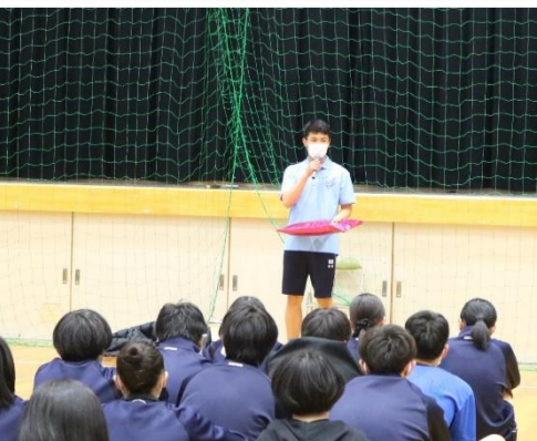
旭陵祭のクラスTシャツを着て行いました。右下は表彰式の様子。