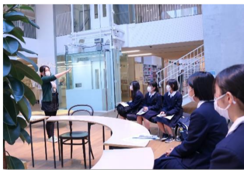
左:語学(JICA 中部なごや地球ひろば)、右:文学(信州大学)