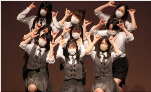
2A 『This is Me』

2年生は初めての体育館での演示でしたが、完成度の高いダンスやストーリー性のある構成で、観客を飽きさせない工夫がされていました。1年生も細部にこだわったり、入口などの飾りつけをきれいに施したりして、見る人を飽きさせない展示となっていました。