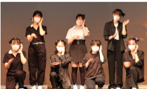
2E 『青春盛り上げ隊の大冒険』