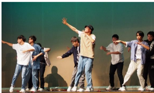
2D 『NKT Dance Battle』