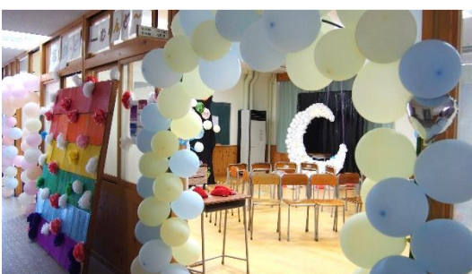
1E 『夢の国 ~どリーむらんど~』