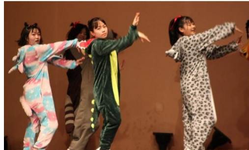
2B 『Count Down Live』