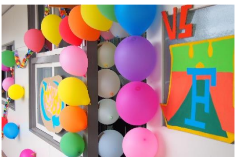
1F 『VS 1F』