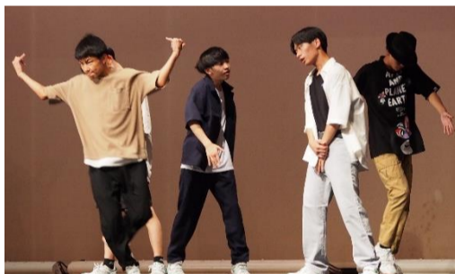
2F 『日韓連盟《はい、資料集 29 パージひらけ》』