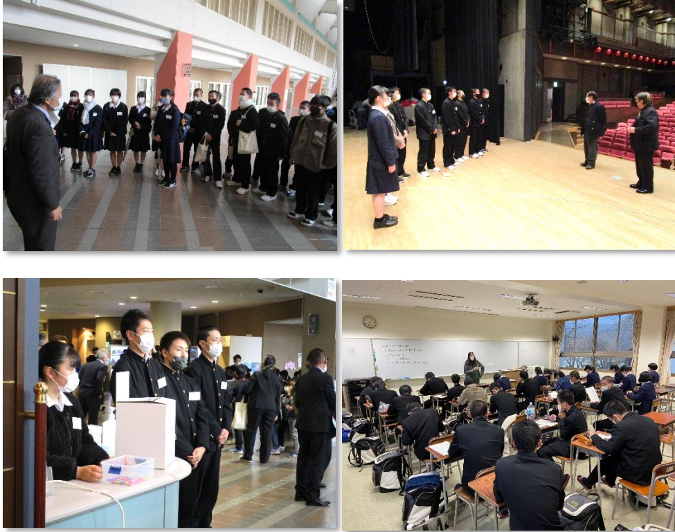
左:受付担当の生徒 右:翌週の事後指導の様子

本校では、ボランティア活動への積極的な参加を奨励しています。今年度もコロナ禍で、ボランティア活動の機会が少なくなっていますが、12月4日（土）に開催された第35回ジュニア文化祭のサポートに多くの生徒が参加してくれました。今後も社会に目を向け、地域のために若い力を多方面で発揮してくれることを願っています。