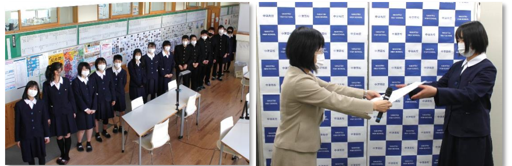
左:待機する表彰者 右:伝達表彰を中継する様子