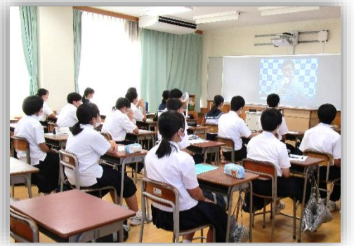
各教室からオンラインで学校説明