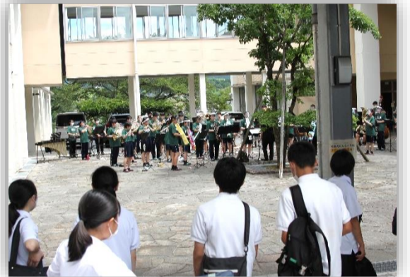
お見送りの吹奏楽部の演奏