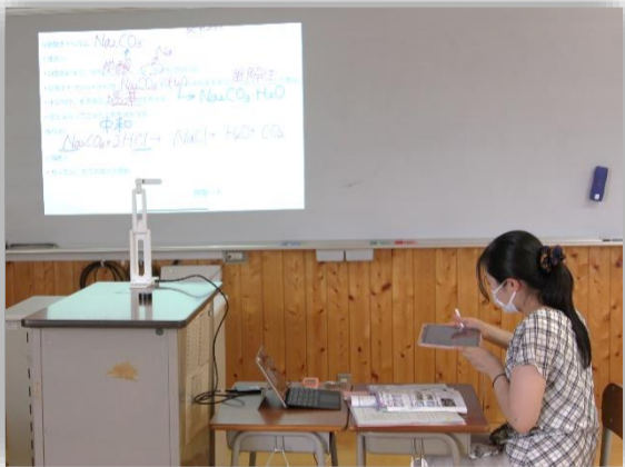
パワーポイント、メタモジ、実物投影機、タブレットなど様々活用