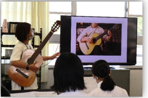
体験授業の様子(英語・数学・国語・理科・社会・音楽・美術)