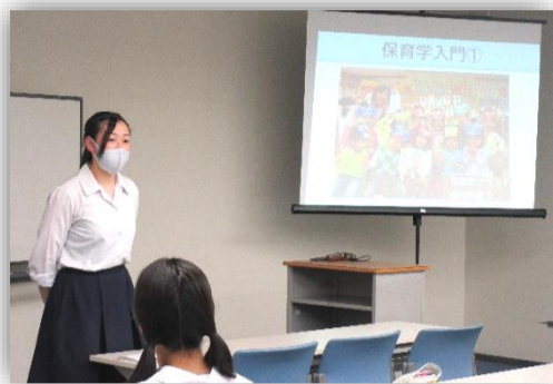
開講式で本校生徒が素敵な挨拶

今年度も中京学院大学との高大連携講座を行います。週1回放課後に、中京学院大学の先生から高校では学べない内容を講義や実習にて教えていただきます。今年度は、経営学・看護学・保育学の3講座です。5月18日(火)に開講式が行われ、本校からは37名の生徒が参加をしました。新型コロナウイルス感染症予防に配慮しながら、有意義な学びとし、自分の希望する進路実現の一助となることを願っています。