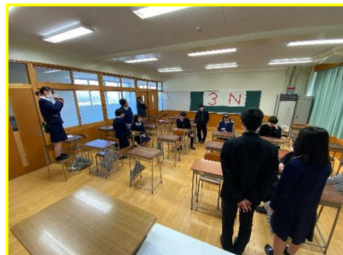
ドラマの撮影の様子。ドローンやカメラを複数駆使して本格的に撮影しました。