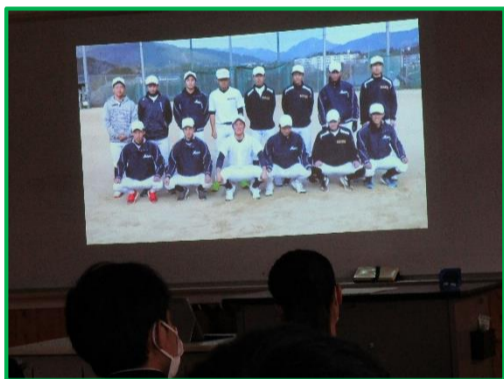
左:思い出のスライドショー 右:部活動の後輩からメッセージ