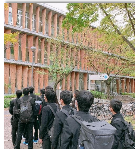
信州大学校内の様子