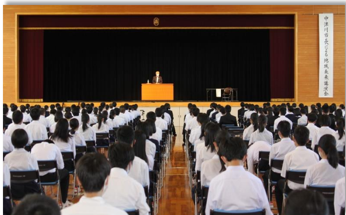
大変ご多忙の中、ありがとうございました！