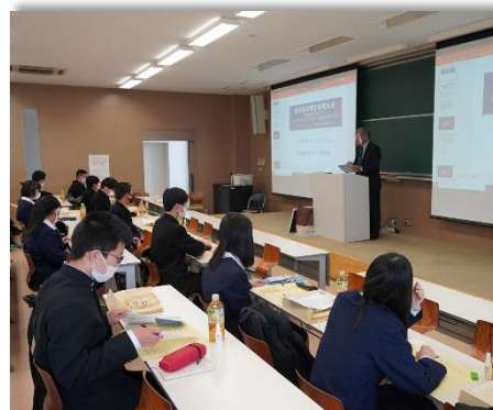
教育講座の模擬授業の様子