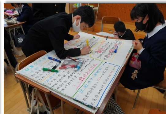
事後のポスターセッションの準備の様子