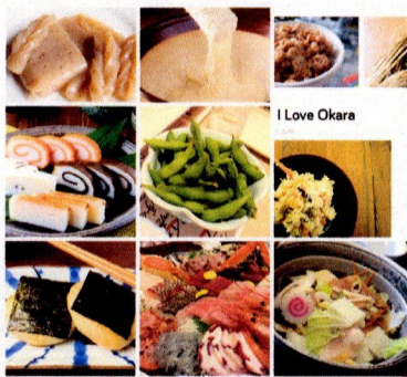
Konnyaku (こんにゃく) Tororo (とろろ) Natto (納豆)

日本では沢山物事があるドイツではなにも。私はよく「ええ何にこれを見たことないよ」と思いますが、私が持ち帰りたいのいくつかは：