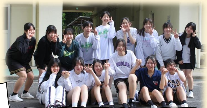
R8 年度 1~3 年生メンバー (IH 予選の会場にて)