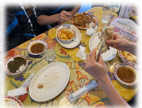
おいしくて食べすぎたカレー