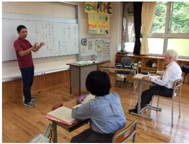
教育課程AB 教科学習(国語総合)