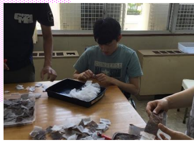
教育課程C 作業学習