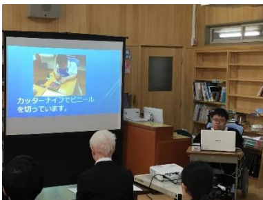
教育課程ABC 総合的な学習の時間 (キャリア学習発表会)