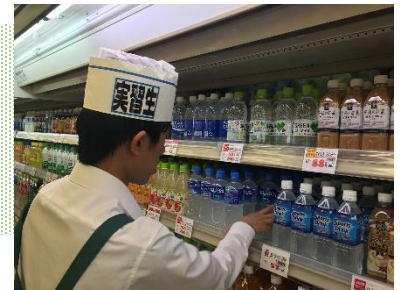
教育課程C 企業内作業学習 高等部卒業後の進路について