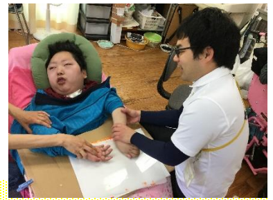
教育課程D 自立活動