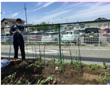
教育課程C 生活単元学習