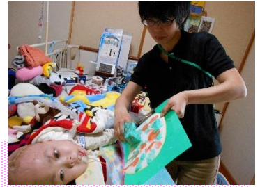
訪問教育(家庭への訪問)