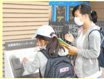
社会見学 (イオンモール各務原)