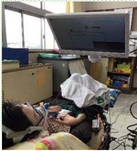
ICT機器を活用した授業