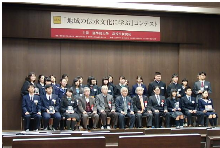
【入賞者全員で記念撮影】

12月4日（日）に國學院大学（東京都渋谷区）で第12回「地域の伝承文化に学ぶ」コンテスト表彰式が行われ、本校生徒3名が出席しました。また、最優秀賞を受賞した「地域研究」のメンバー2名が作品を紹介するプレゼンテーションを行いました。