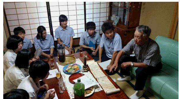
【仏ヶ尾山の由来となった話を聞く】