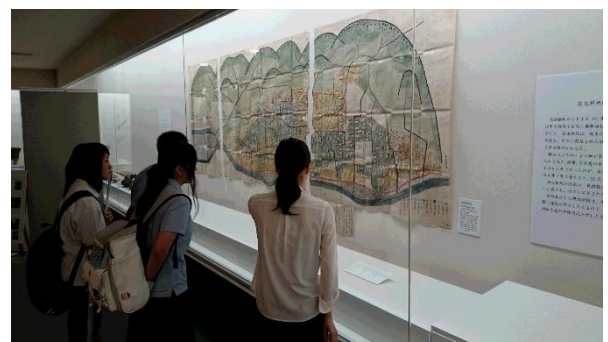
【下呂市ふるさと記念館で中呂村絵図を見る】

※これらの活動は「岐阜新聞」（12月9日<金>）、「中日新聞」（12月10日<土>）でも紹介されています。ぜひ、お読みください。また、研究内容は今後冊子にまとめ、広報していく予定です。