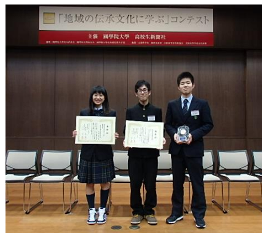
【笑顔で表彰されました】