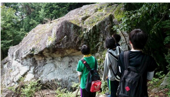
【雨乞い伝説の「穴岩」の現地調査】