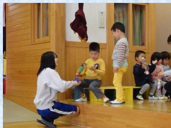
健康福祉系列保育コースの 職場体験②

【生徒の感想】 三日間を通して、レストランの裏方を体験させていただきました。働くことの楽しさと大変さを実感できました。どんなに早く作業しても、丁寧に正確にこなすことが大切だと思いました。初めてやることはばかりで、数日間できただけ何をやるか早く覚えて、同じ職場の人の立場や性格などを理解しながら一緒に働こうとする力が必要だと感じました。 今回、初めて接客をしました。お客様に声をかけられて緊張が少しとけたし、お客様とのコミュニケーションは大切だと実感しました。接客するには、やはり、はきはきと話すことと、笑顔、お客様のために何ができるのかを考えることが大切なことだと思いました。