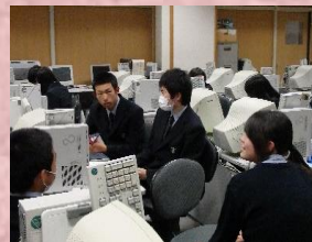
言語・文化系列の授業 コミュニケーションを大事にしています

十月から後期日程に入った益田清風高校ですが、「産業社会と人間」では、二年生から選択した系列の基礎講座を開講中です。生徒たちは、言語・文化系列の英語の授業、観光産業系列の地域研究コースの授業、簿記資格コースの授業、健康福祉系列の社会福祉基礎の授業をそれぞれ選択しています。実際の授業を受けることで、具体的な系列選択のイメージがわいてきます。この講座を受けて、いよいよ十二月には本登録となります。