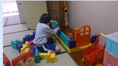
観光産業系列の職場体験② キッズルームの整理の様子