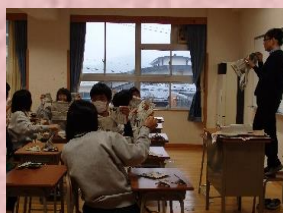
健康福祉系列の授業 「子供が遊ぶ遊び」をテーマに作品を作りました