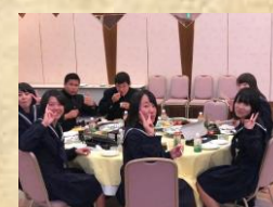
会場準備をしまし、昼食も満足になりました。ランティアでした