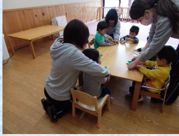
健康福祉系列保育コースの 職場体験①