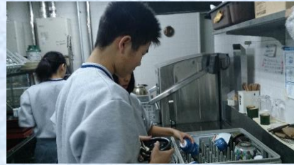
観光産業系列の職場体験① 宿泊施設の調理場補助の様子

十一月八日（火）～十日（木）の三日間にわたり、観光産業系列と健康福祉系列保育コース二年生が下呂市内で職場体験を行いました。二回目となる職場体験で、前回と同じ施設での実習ということもあり、施設の方々のご協力のもとで、任せていただく仕事も増えて充実した職場体験となりました。学校の中ではできない貴重な体験となりました。