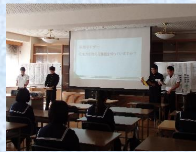
観光産業系列の体験授業