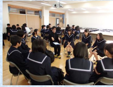
在校生と語る会の様子