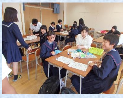
健康福祉系列の体験授業